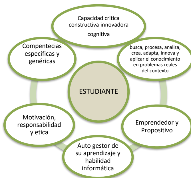
Figura 2: Rol del estudiante

Nota: La Figura, representa el rol del estudiante en la modalidad a distancia