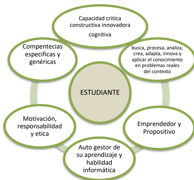
Figura 2: Rol del estudiante

Nota: La Figura, representa el rol del estudiante en la modalidad a distancia